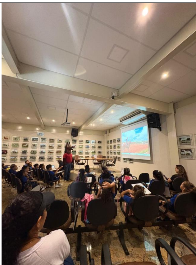
Registro da leitura da cartilha e do filme sobre as raízes do Parque e da ABCCMM