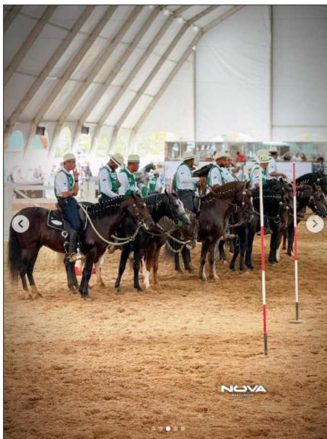
Registro dos animais aguardando julgamento após exibição de marcha.

Além do caráter esportivo, o CBM costuma movimentar fortemente a economia do entorno e do próprio evento, com presença de expositores, prestadores de serviço e intensa circulação de público, consolidando-se como um evento estruturante do calendário do setor.